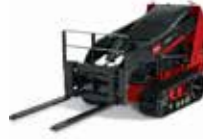
Çift Dişli Yükleyici