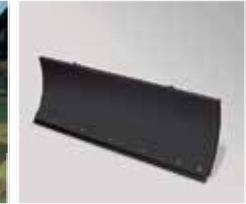
Kar küreme bıçağı