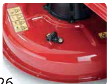
26 Bıçak Gövdesi Yıkama Girişi