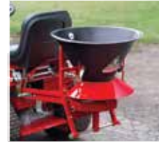
Gübre atma ekipmanı