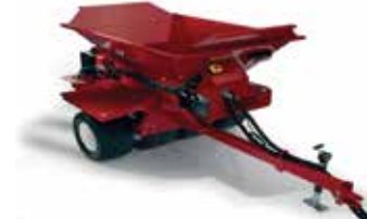
Toro Topdresser 2500 %30 artırılabilir 900 lt hazne kapasitesi 152 cm serpm genişliği 930 kg taşıma kapasitesi 659 kg ağırlık Traktör arkası çeki sistemi