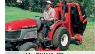
ÇİM KESME ÜNİTESİ