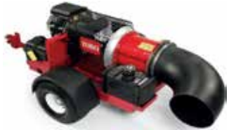
Toro Debris Blower Üfürme Makinesi 27 Hp Kohler Motor 360 derece dönebilen başlık 33 cm çapında nozul 216 kg ağırlık