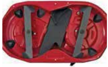
Özel Tasarımlı Gövde