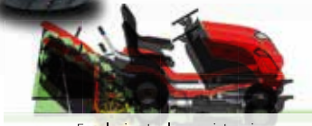
Fırçalı çim toplama sistemi