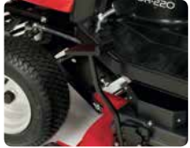
İsteğe Bağlı Geri Dönüştürme (Mulching)